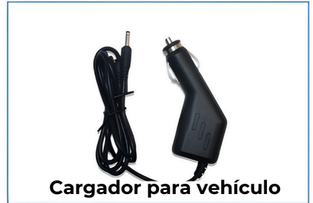
Cargador para vehículo